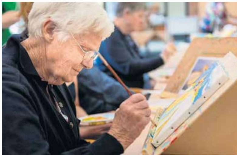
WINSUM Vijftien bewoners van het Winsumer verpleeghuis De Twaalf Hoven kregen gistermiddag een workshop beeldende kunst onder leiding van Hilli Kuilman. De kunstenaress hielp de bewoners bij het maken van stillevens. De workshop vond plaats in het kader van de Week van de Dementie.